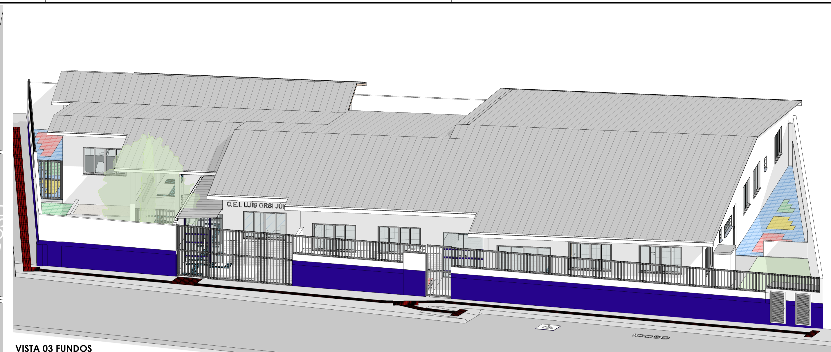
VISTA 03 FUNDOS