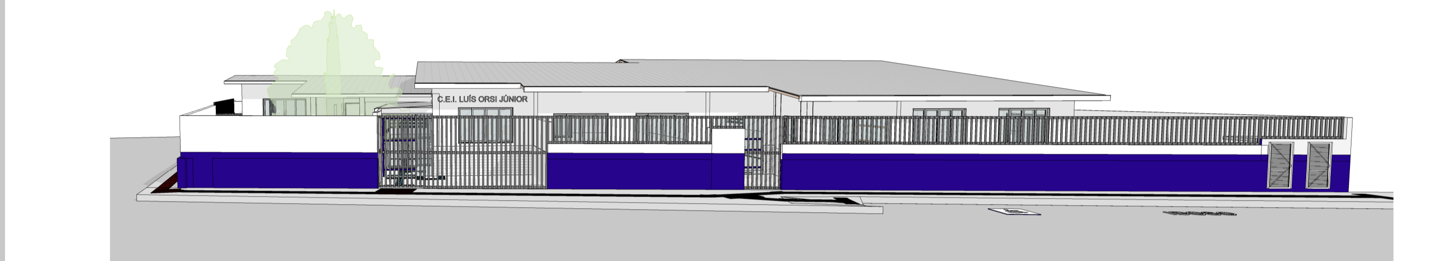
VISTA 04 FACHADA NORTE