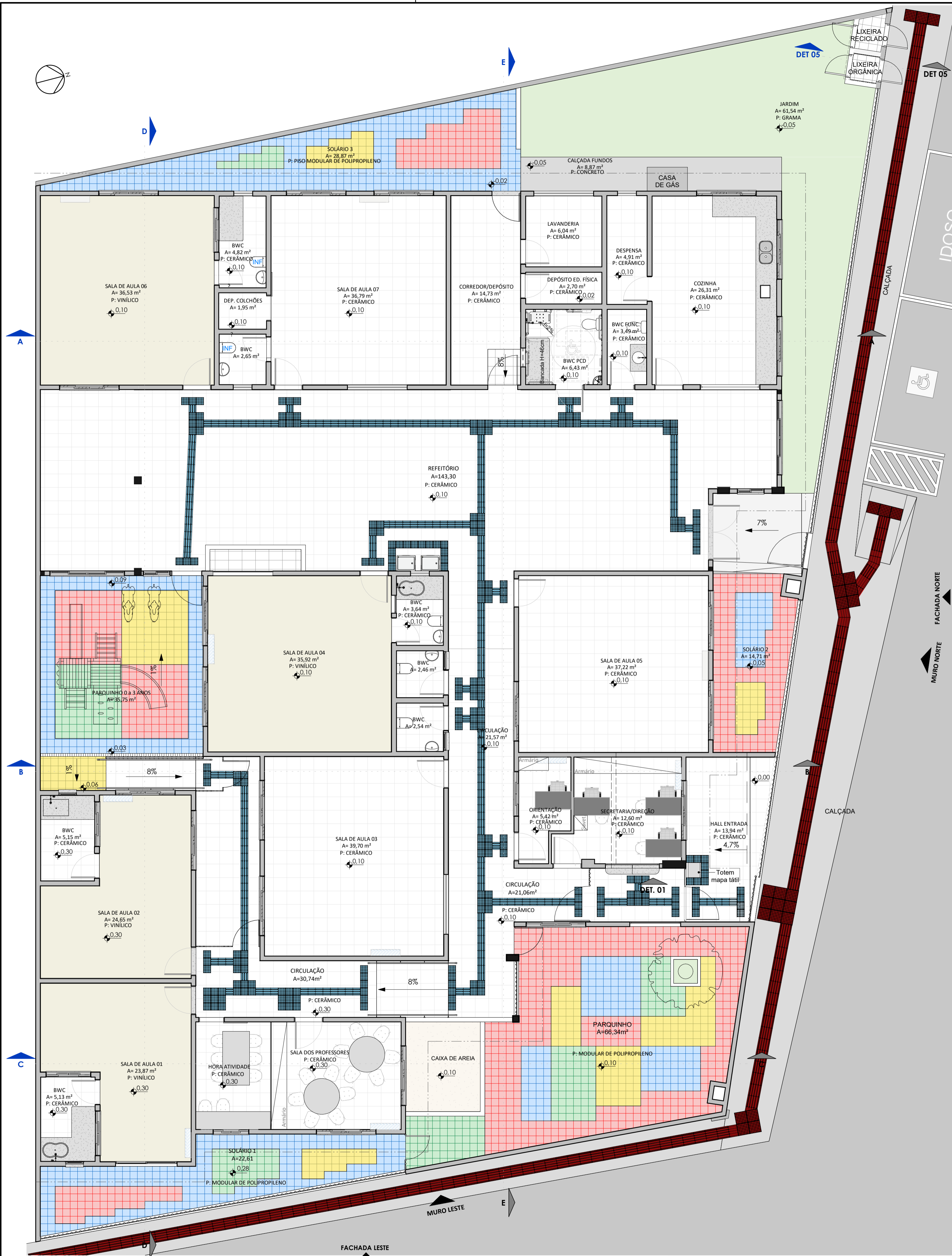
PLANTA BAIXA TÉRREO LAYOUT ESC:1 : 75